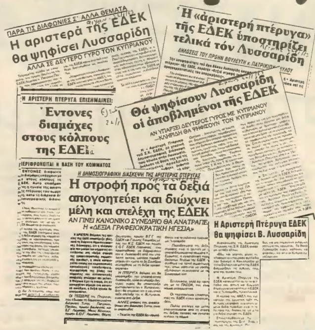
Τη δημοσιογραφική διάσκεψη που δόθηκε στις 21.1.83 κάλυψε στο σύνολο του ο καθημερινός τύπος εκτος απο τα «ΝΕΑ».

Τα συμπεράσματα μας απο όλη τη προεκλογική καμπάνια